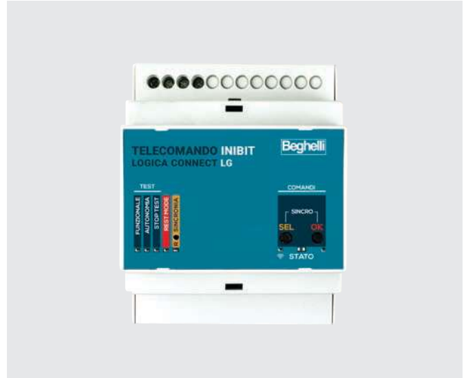
TELECOMANDO INIBIT LG