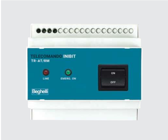
TELECOMANDO INIBIT RM